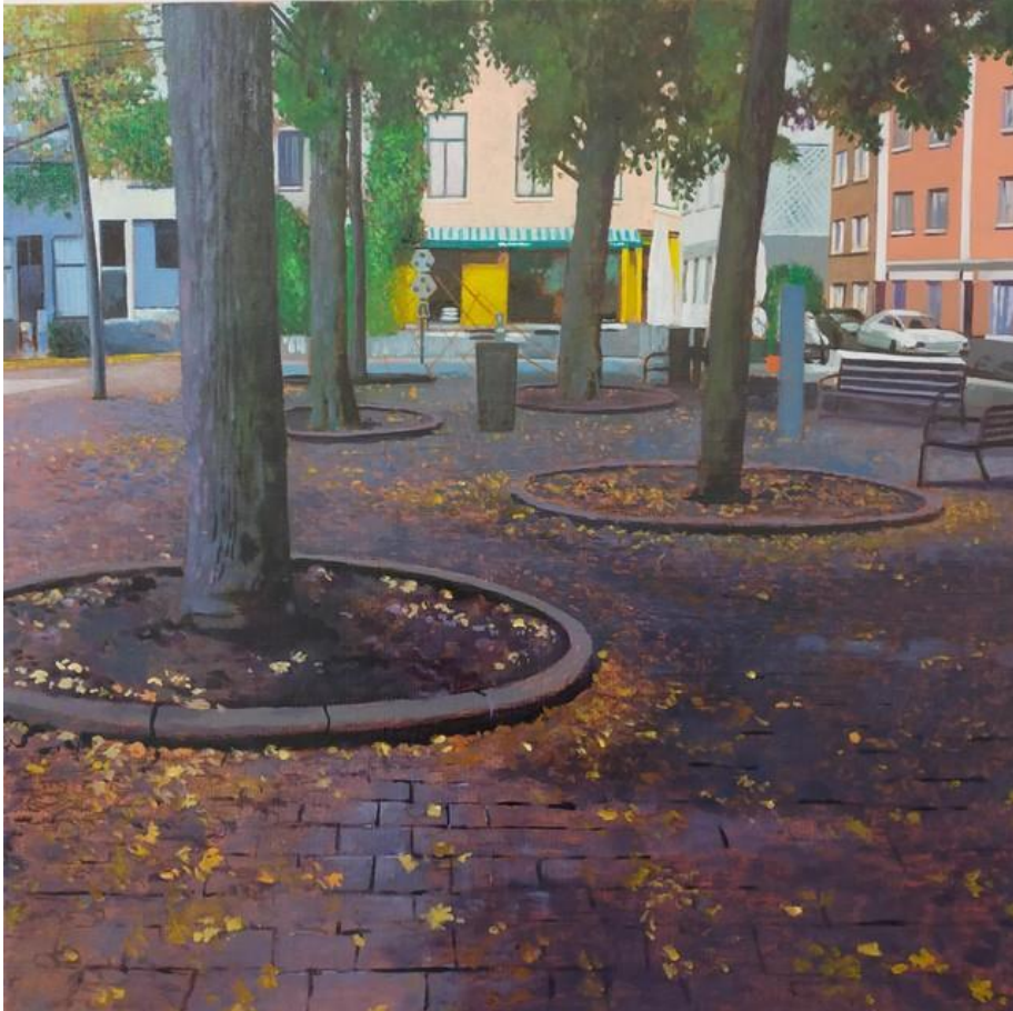
Sint-Andriesplaats.